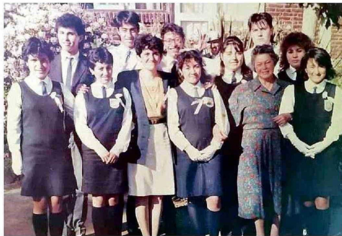
UNA DE SUS PRIMERAS LICENCIATURAS DE CUARTO MEDIO A INICIOS DE LOS 90.

-Soy muy querendona sobre todo de los chiquillos. Me afecta mucho cuando tengo que tomar medidas drásticas, porque es la única manera de defenderlos de ellos mismos, de las cosas que esta sociedad actual nos está presentando. De toda mi historia, que ha sido larga y ha tenido de todo, en un año alcancé a contabilizar que les hacía