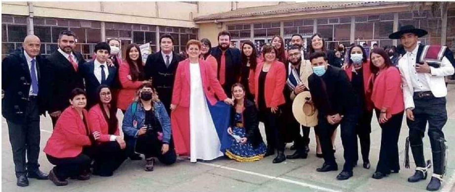
LA DIRECTORA PARTICIPA EN LAS ACTIVIDADES DEL LICEO Y ASEGURA QUE ES DE PUERTAS ABIERTAS CON LOS ESTUDIANTES.