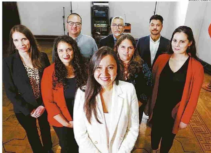
AYER COMENZARON EN SUS FUNCIONES LOS DIRECTIVOS QUE FORMAN EL CÍRCULO DE HIERRO DEL MUNICIPIO.

8 son los profesionales designados por la alcaldesa y que serán parte de su equipo directivo.