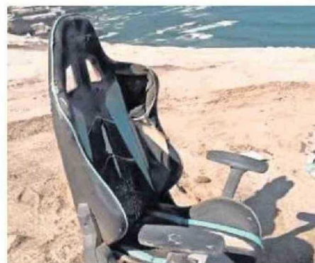
LA PRESENCIA DE BASURA Y DESECHOS EN LA PORTADA.

En el video, el tiktokер manifiesta que "este podría ser uno de los monumentos naturales más lindos de Chile. La-