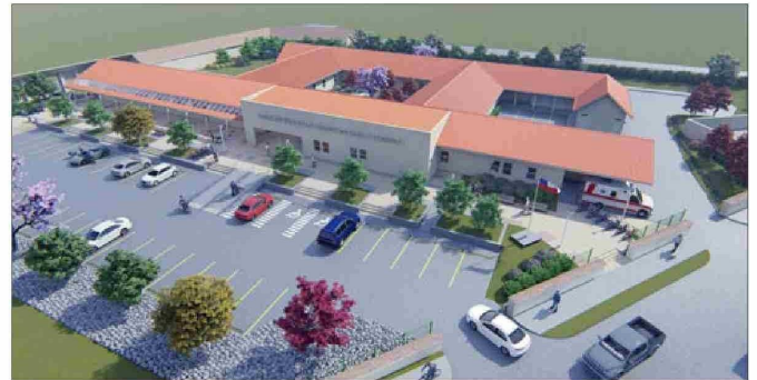
Imagen computacional de cómo sería el nuevo Cesfam Valle Los Libertadores de Putaendo.

Boric en la Cuenta Pública 2024 y se mostró esperanzado de que se pueda cumplir con el proyecto para 2026. «En relación al anuncio que realiza el Presidente de la República en el marco de su Cuenta Pública, y que indica que al 2026 estará construido el consultorio familiar Valle de Los Libertadores de nuestra comuna de Putaendo, no me queda más que sentirnos agradecidos y, por supuesto, esperanzados de que esta obra, efectivamente, que hemos esperado durante muchos años, pueda