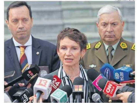
TOHÁ DESTACÓ ACCIONES DEL GOBIERNO CONTRA EL CRIMEN.