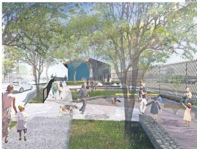
PROYECTO CONTEMPLA EL REARME DE LA ESTACIÓN DEL TREN Y CONECTARLA CON UN CENTRO CULTURAL.

La tercera y última etapa del proyecto de modernización del eje Balmaceda se encuentra pendiente desde el año 2015, cuando finalizaron las obras del segundo tramo, correspondiente desde calle An-