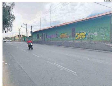
LOS TRABAJOS SE INICIARÁN A MEDIADOS DEL PRÓXIMO AÑO.

“Será la estación de trenes de la avenida Balmaceda un punto no sólo de encuentro para los loínos, será el reconocimiento al valor patrimonial que la comunidad siente con su historia y también de la importancia que tuvo en su momento. Valoramos que se haya ya definido el cierre de estas