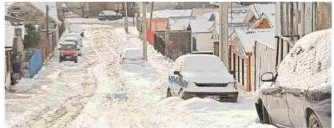
La calle Sara Braun, en población Carlos Ibáñez, era una de las pendientes que complicaba el desplazamiento vehicular.