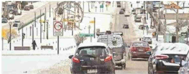
La Avenida Salvador Allende fue una de las vías que se privilegió con el despeje de la nieve.