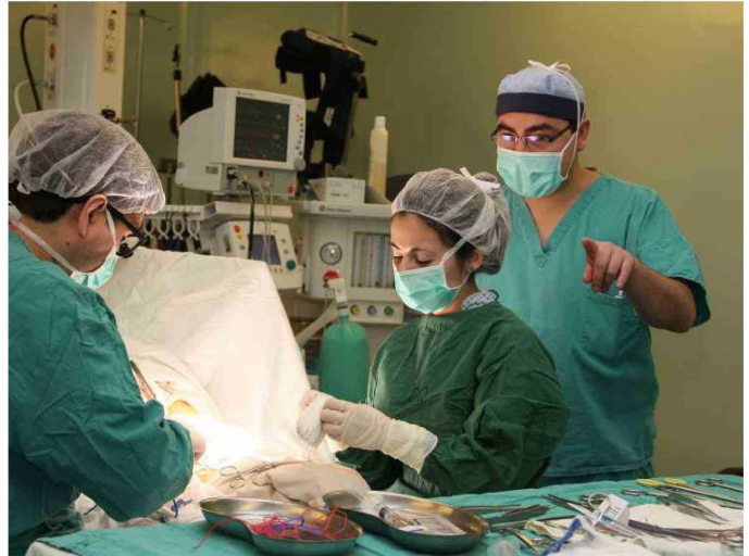
UN CRECIENTE NÚMERO DE CIRUGÍAS HAN DEBIDO SER POSTERGADAS POR FALTA DE RECURSOS EN EL HOSPITAL CLÍNICO DE MAGALLANES.

"Eso es inaceptable, ¿usted permitiría que cualquier persona atienda a un familiar suyo exponiéndolo a una negligencia médica?, no podemos transar en ello... hoy se falsifican diplomas con una facilidad enorme y ni hablar de lo que pasó