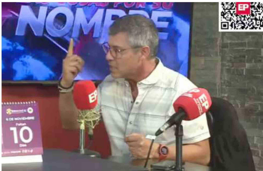
EL PRESIDENTE REGIONAL DEL COLEGIO MÉDICO AFIRMÓ QUE EL SISTEMA NO SÓLO ESTÁ PRESIONADO POR UNA MAYOR CANTIDAD DE PRESTACIONES, MAYORES BENEFICIOS Y UN MASIVO AUMENTO DE USUARIOS.

“Efectivamente, el Gobierno Regional no tiene ninguna obligación de hacerlo, pero ahora lo hicieron porque estamos en una situación bastante fea en este sentido. Cuando hablas con las autoridades, te dicen que