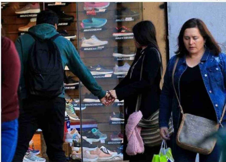
LAS BAJAS EN VESTUARIO Y CALZADO COMPENSARON ALZAS EN ALIMENTOS Y SERVICIOS BÁSICOS DEL IPC.

Cabe mencionar que las 2 divisiones que encabezaron las alzas e incidencias positivas en el IPC de junio son las 2 de ma-