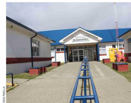
El Cesfam Bencur atiende a 33 mil usuarios.

● Proyecto se enmarca dentro de la cartera de iniciativas de conservación de los establecimientos de atención primaria de Salud, mejorando las condiciones de atención y trabajo en distintos puntos del territorio.