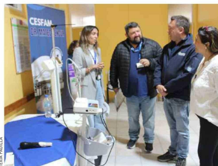
El alcalde se reunió con directivos del Cesfam para inspeccionar los mejoramientos.