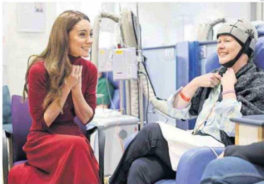
LA PRINCESA COMPARTIÓ CON LOS PACIENTES DEL HOSPITAL ROYAL MARSDEN.

La esposa del príncipe William aseguró que "era agrada-