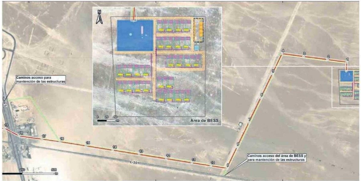
EL PROYECTO BESS CÁLÍCE SE UBICARÍA EN CALDERA Y CON DECENAS DE BATERÍAS BUSCA INYECTAR ENERGÍA AL SISTEMA EN LAS HORAS DE MAYOR DEMANDA.

Eso sí, no todo ha sido pura aprobación. A fines del año pasado, un proyecto BESS que buscaba desarrollarse en Diego de Almagro, con una inversión su-