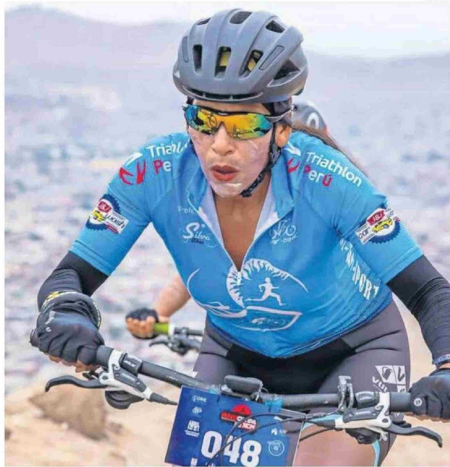
INSCRIPCIONES A LA CITA "XCM" SERÁN HASTA EL DÍA 25 DE NOVIEMBRE POR SPORT XV.