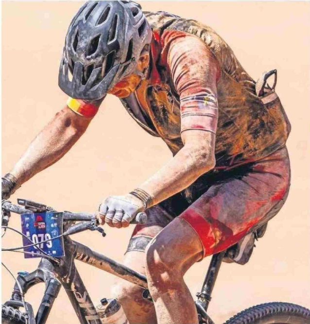
CICLISTAS "PRO" Y "AMATEURS" PODRÁN MEDIRSE EN CIRCUITOS DE 77 Y 32 KILOMETROS.