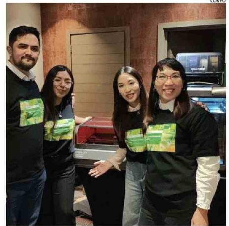
PAKARINA 3D ES EL NOMBRE DE LA PYME ARIQUEÑA QUE PARTICIPÓ.