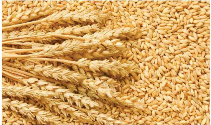
LOS ANUNCIOS DE CAMPAÑA del actual presidente de Estados Unidos, Donald Trump, podrían desacelerar el crecimiento de los países desarrollados, afectando el comercio de granos.

Por su parte, en Argentina, las restricciones a la exportación de trigo, implementadas para controlar la inflación interna, podrían alterar los flujos comer-