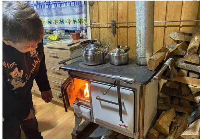
LA LEÑA SIGUE SIENDO EL COMBUSTIBLE MÁS USADO PARA CALEFACCIONAR LOS HOGARES.

es el precio de la recarga de gas licuado de 5 kilos: $25 mil la recarga de 11 kilos; $27 mil la recarga de 15 kilos y $89 mil la recarga de 45 kilos de gas licuado.