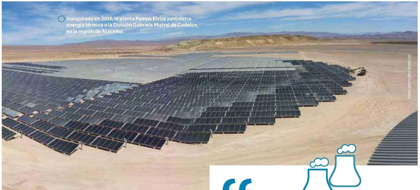
○ Inaugurada en 2013, la planta Pampa Elvira suministra energía térmica a la División Gabriela Mistral de Codelco, en la región de Atacama.