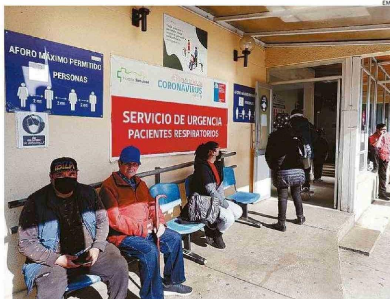
LA ATENCIÓN EN EL SERVICIO DE URGENCIA Y TAMBIÉN EL PODER OPERARSE SON ALGUNOS PUNTOS DÉBILES.