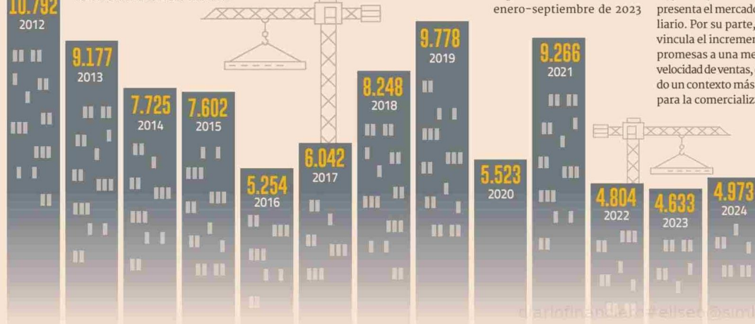
Promesas de venta inmobiliaria de siete empresas abiertas en bolsa TOTAL UNIDADES A SEPTIEMBRE

Por su parte, Moller logró reducir su nivel de renuncias gracias a políticas comerciales implementadas en los últimos años, orientadas a asegurar que las tasas de negocios reflejen de manera precisa las ventas del período.