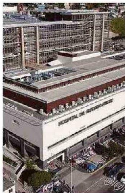
OCURRIÓ LA MAÑANA DEL SÁBADO.