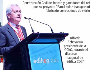
Alfredo Echavarría, presidente de la CChC, durante el discurso inaugural de Edifica 2024.