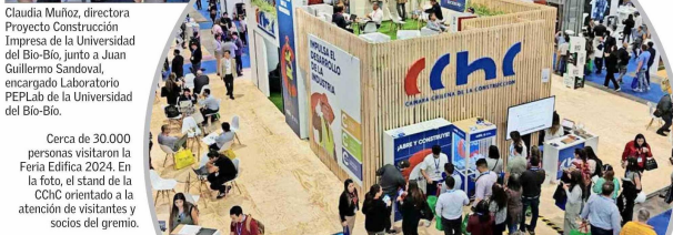
Cerca de 30.000 personas visitaron la Feria Edifica 2024. En la foto, el stand de la CChC orientado a la atención de visitantes y socios del gremio.