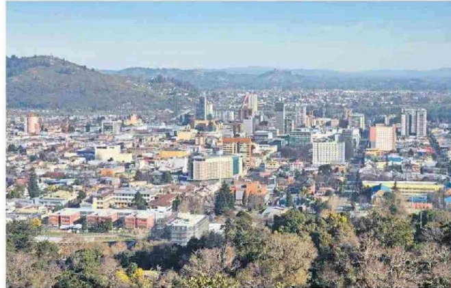
TEMUCO SE PUEDE VER DESDE LA CUMBRE DEL CERRO ÑIELOL.

sólo cuenta con este coloso deportivo, sino con un parque de juegos infantiles, áreas verdes, una laguna, canchas de tenis y de patinaje (techada), también colinda con la Piscina Municipal.