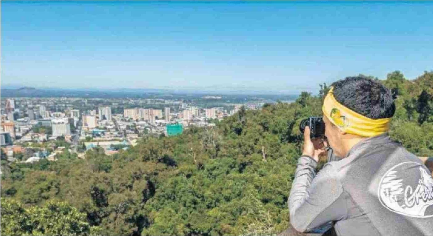
EL MONUMENTO NATURAL CERRO ÑIELOL OFRECE MIRADORES EN MEDIO DE LA VEGETACIÓN NATIVA DEL RECINTO.