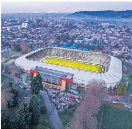
EL ESTADIO BICENTENARIO G. BECKER ES UNA PARADA DEL TOUR.