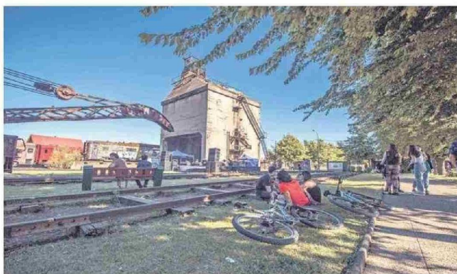
LA CARBONERA DEL MUSEO NACIONAL FERROVIARIO PABLO NERUDA ES UN ELEMENTO DISTINTIVO.

EN PANDEMIA Y POST PANDEMIA EL PARQUE URBANO ISLA CAUTÍN HA SIDO UN LUGAR DE ENCUENTRO CON LA NATURALEZA A CORTA DISTANCIA DEL CENTRO DE TEMUCO.