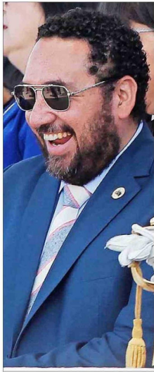
Nicolás Cataldo , ministro de Educación, en la Parada Militar.

Así, enfatiza: “Yo trataría de no calificarlo como una irresponsabilidad; al contrario, es justamente porque queremos ser responsables sobre la discu-