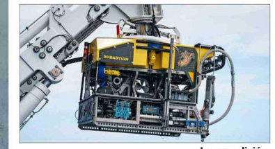
La expedición recorrió la zona cercana a la península de Taitao en el buque "Falkor (too)". A bordo, el robot submarino Subastian, que puede extraer muestras a más de 4 mil metros de profundidad.