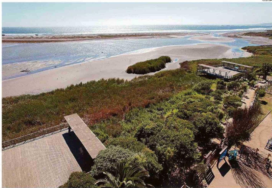
EL PARQUE ECOLÓGICO LA ISLA Y LA DESEMBOCADURA DEL RÍO ACONCAGUA, UN HÁBITAT FUNDAMENTAL PARA DIVERSAS ESPECIES.

especies de aves están presentes en el humedal de Concón, muchas de ellas son especies migratorias.