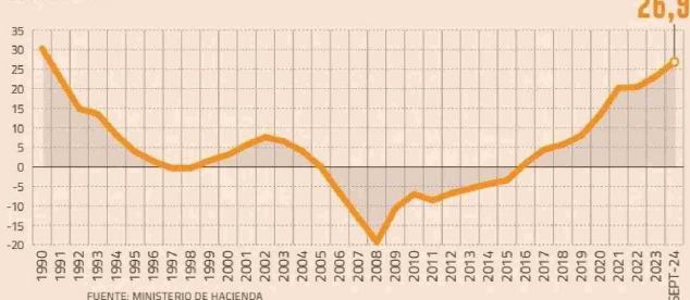
DEUDA NETA DEL GOBIERNO CENTRAL COMO % DEL PIB