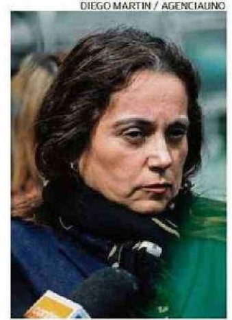
DIEGO MARTIN / AGENCIAUNO