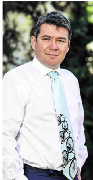
Marcelo Mena, exministro de Medio Ambiente.

En esa línea, plantea que el nuevo pronunciamiento "sin duda está tratando de limitar el ámbito de su decisión (Comité de Ministros), a tal punto que el único resultado que pareciera ser que satisface es la aprobación del proyecto, y por tanto me parece una intervención indebida con respecto a lo que debe tener un Comité de Ministros, que es