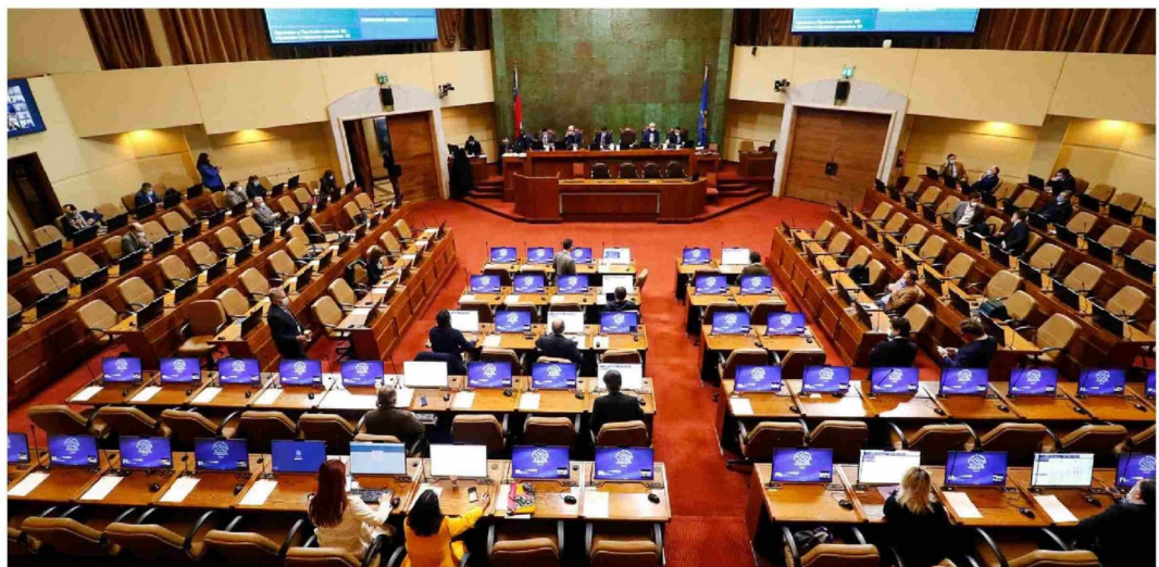
LOS REPRESENTANTES del distrito 21 en la Cámara de Diputados deben volver a elegirse en los comicios de noviembre.

Con el objetivo de “ganar terreno”, varios son ya los políticos que han revelado públicamente sus intenciones de presentarse a los comicios de diputado. Pero hay algunos que se mantienen en cautela, a la espera de reuniones que los ratifiquen en determinadas listas e, incluso, en otros distritos.