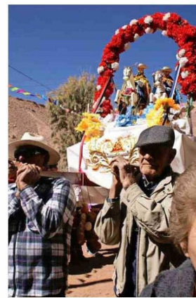
Fiesta religiosa en Río Grande.

Esta caminata de 16,1 kilómetros en total (unas 6 horas) parte en el pueblo de Machuca , que está 46 kilómetros al noreste de San Pedro (una hora en auto), por el mismo camino que va a las termas de Puritama y los géiseres del Tatio. Machuca está a casi 4.000 metros de altura y allí vive una decena de personas en forma permanente. El pueblo suele ser escala de los tures que van al Tatio: al regreso, la gente espera a los turistas con anticuchos de llama, empanadas de queso de cabra y té de chachacoma, una hierba muy popular en la zona.