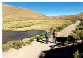
La ruta se hace en unas 6 horas.