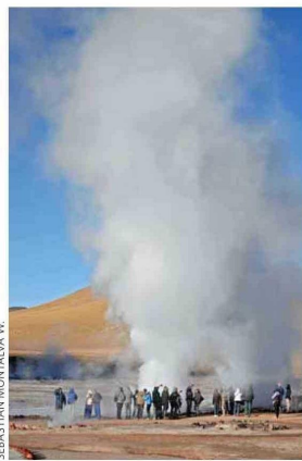
Géisers del Tatio.

DE DIFICULTAD MEDIA, ESTE SENDERO —DESCRITO EN LA GUÍA DE DOMINGO LOS 25 MEJORES TREKKINGS EN SAN PEDRO DE ATACAMA— PERMITE DESCUBRIR UNO DE LOS LADOS MÁS VERDES DEL DESTINO MÁS FAMOSO DEL DESIERTO CHILENO. POR Sebastián Montalva W.