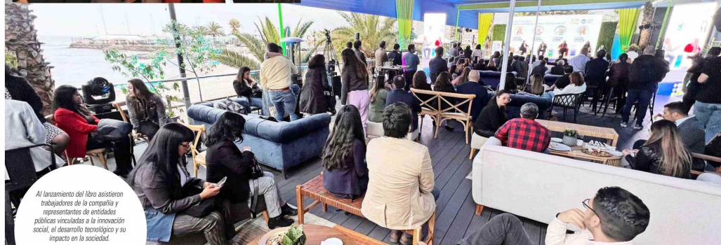
Al lanzamiento del libro asistieron trabajadores de la compañía y representantes de entidades públicas vinculadas a la innovación social, el desarrollo tecnológico y su impacto en la sociedad.