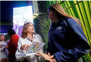
Los asistentes pudieron quedarse con una copia del libro "Los 20 de Innovación: Testimonios de creatividad, visión y colaboración al interior de SQM".