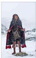
El documental recrea los meses previos a la muerte del niño.