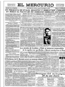
"El Mercurio" del 24 de agosto de 1939 informó del pacto.

"Para los socialistas, este pacto fue objeto de fuertes críticas porque el Partido Comu-