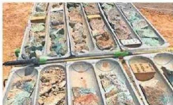
LA MINERA ESTÁ EMPLAZADA EN MEJILLONES.