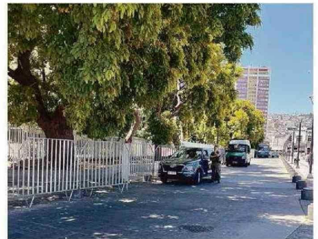
CARABINEROS DISPUSO DE PUNTO FIJO EN EL ÁREA.

"Lo que se hizo en el Congreso Nacional fue una ampliación del perímetro de seguridad. Consiste en afectar solamente la calle Rawson y Victoria, ampliar la malla de contención, para que haya un orden, y por supuesto, co-