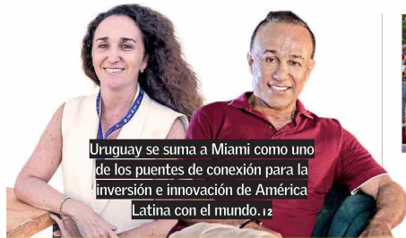
Uruguay se suma a Miami como uno de los puentes de conexión para la inversión e innovación de América Latina con el mundo. 12