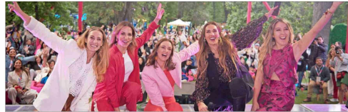
Financiamiento inclusivo, capacitación integral y redes de apoyo: los 3 ejes del petitorio de Fundadoras para potenciar el emprendimiento femenino. 14