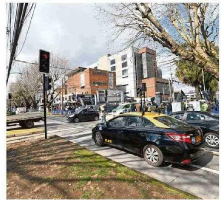
EL SEMÁFORO FUE ENCENDIDO AYER AL MEDIODÍA EN LA ESQUINA.