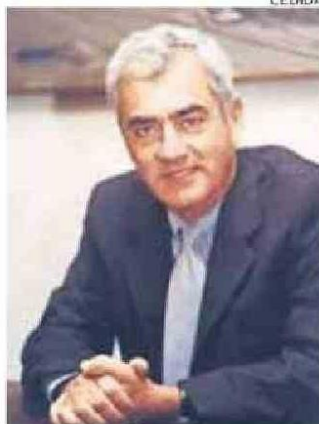
LIDERÓ MINERÍA EN 2002-2006.