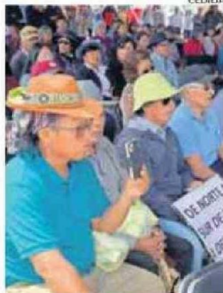
SOLCOR SERÁ LA ANFITRIONA.