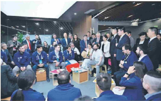
Veinte profesionales visitaron China en el marco del programa New Energy Talent.

de PIB ha disminuido un 26%. Además del desarrollo verde propio, China proporciona el 70% de los componentes fotovoltaicos, el 60% de los equipos de energía eólica y el 60% de los vehículos eléctricos del mundo. Solo en 2023, las exportaciones de productos eólicos y fotovoltaicos ayudaron a los demás países en el mundo a reducir 810 millones de toneladas de emisiones de carbono. En la última década, los costos promedios de la energía eólica y solar a nivel mundial han disminuido en un 60% y 80% respectivamente, y una gran parte de esa reducción de costo se debe a la contribución de China.