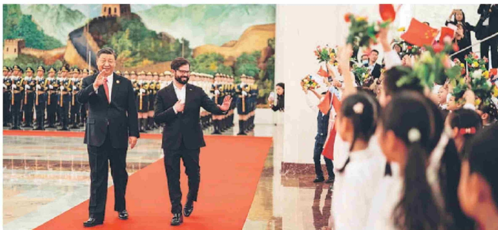
El Presidente Xi Jinping junto al Presidente Gabriel Boric en su visita de Estado a China en octubre de 2023.

El caso de Qinghai es un reflejo de toda China. En las últimas dos décadas, China ha plantado más árboles que el total de todos los demás países, contribuyendo con una cuarta parte del aumento global de áreas verdes. China ha establecido la cadena industrial de energía renovable más grande y completa del mundo, y desde 2012, el consumo de energía por unidad