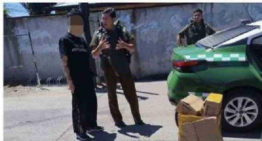
SE ENCONTRARON LOS CIGARRILLOS EN UNA FISCALIZACIÓN REALIZADA EN UN MALL CHINO.

En la fiscalización rutinaria, materializada en un mall chino, se detectó que los productos no contaban con la resolución sanitaria exigida por el Ministerio de Salud para la venta de tabaco. Los cigarrillos decomisados fueron