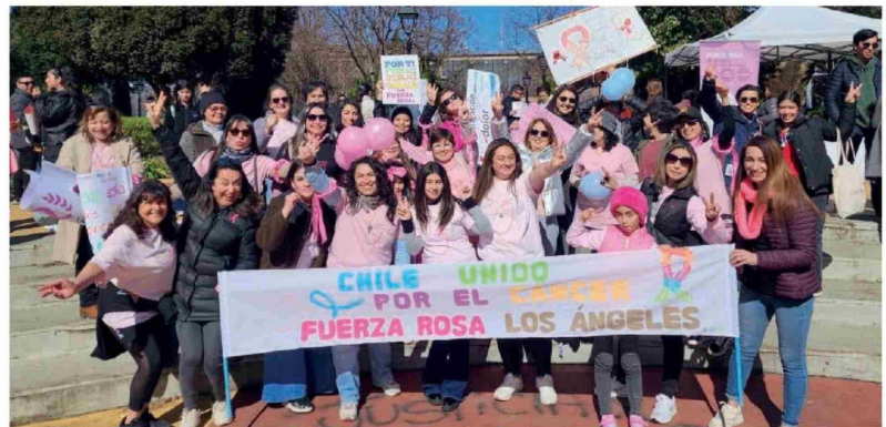
FAMILIAS DE DISTINTAS COMUNAS de la provincia participaron de la marcha nacional de prevención contra el cáncer.