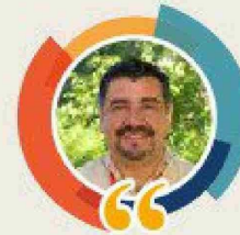
Pablo Yáñez, director regional Sernageomin

Aunque estamos muy bien posicionados en rescate minero, la mejora continua debe ser permanente. Estas capacitaciones nos ayudan a pulirnos y mejorar estos programas, para replicarlos y que sean muchos más los rescatistas que vengan a aprender de nosotros y que nuestros equipos puedan hacer lo mismo”.