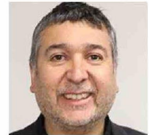
CARLOS ESSE, DIRECTOR DEL INSTITUTO IBEROAMERICANO DE DESARROLLO SOSTENIBLE U. A.