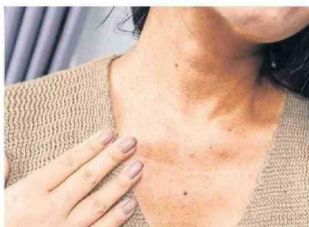
ATENCIÓN CON LAS SEÑALES QUE APARECEN EN EL CUELLO.