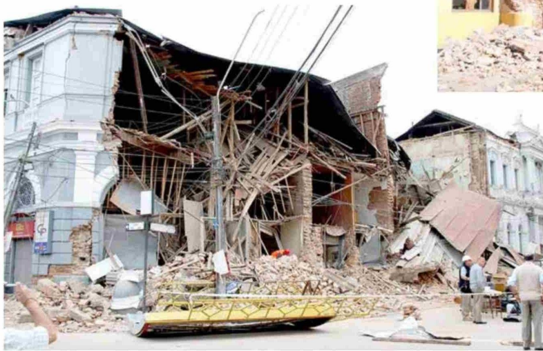
Imágenes que quedaron en la retina de los curicanos.