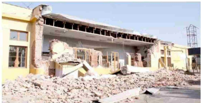
Al cumplirse 15 años del 27/F, muchos recintos emblemáticos siguen sin ser reconstruidos.