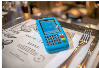
Tradicional restaurante Margó Gourmet.

Chile tiene una de las más altas tasas de consumidores bancarizados en América Latina. Según el Banco Mundial, el 87% de los consumidores en nuestro país cuenta con algún tipo de cuenta financiera. De la mano de esta realidad, Transbank ha sido