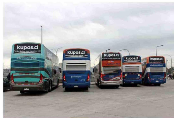
Kupos.cl, principal app de transporte terrestre.

un importante actor a la hora de democratizar el acceso a los medios de pago.