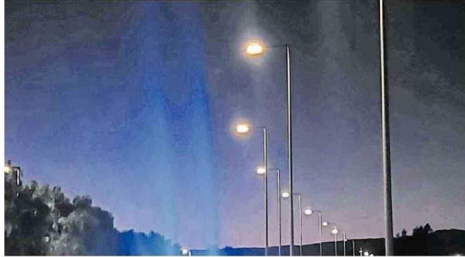
EL ALUMBRADO PÚBLICO DE COPIAPÓ Y ZONAS RURALES SERÁ CAMBIADO POR LUCES LED COMO LAS DEL KAUKARI.