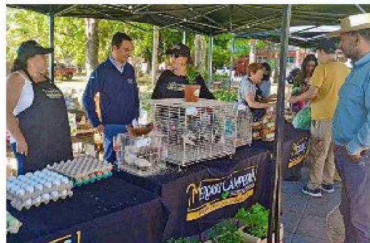
Mercado en Pichilemu.