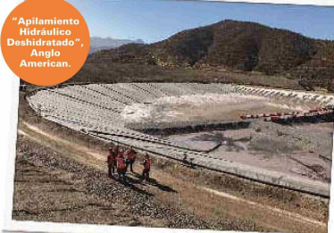
“Apilamiento Hidráulico Deshidratado”, Anglo American.

Adicionalmente, Codelco busca aportar al desarrollo de capital humano con el programa “Piensa Minería”, que entrega financiamiento a estudiantes de doctorado en temas de interés para su operación. Desde 2016, este plan ha beneficiado a 46 alumnos, con una inversión acumulada cercana a US$ 2 millones.