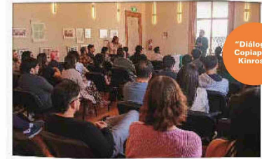
“Diálogos Copiapó” Kinross.

Dentro del plan de actividades, durante este mes y noviembre se realizarán cuatro conversatorios en conjunto con la Universidad de Atacama, el Instituto Santo Tomás, Inacap e Iplacex. En el primer ciclo se abordará la temática del “Empleo y Acceso a Educación Superior”.