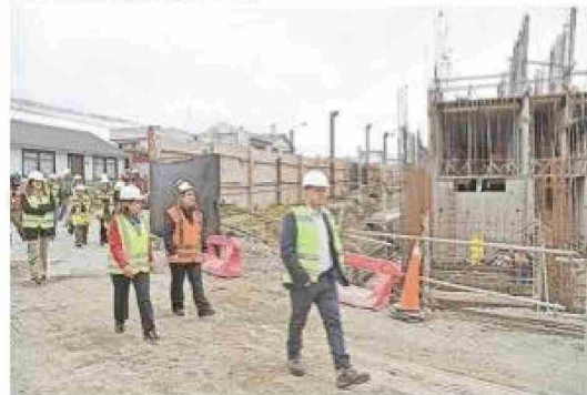
Un 40% de avance presenta el Cesfam 18 de septiembre.

arrastre dos iniciativas: $372 millones destinados al análisis de las cuencas hidrográficas de la región y $2 mil 478 millones para