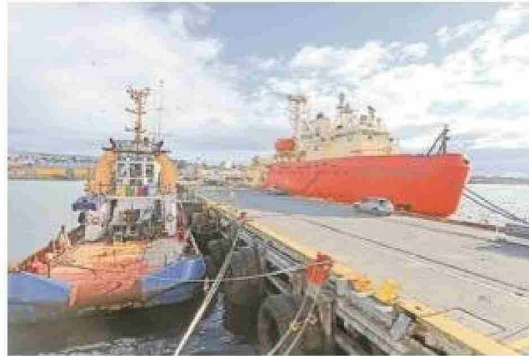
Más de $12 mil millones invertirá este año el Gore y la Epa en mejoramiento de la infraestructura portuaria.